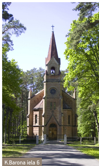
K.Barona iela 6