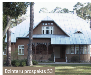
Dzintaru prospekts 53