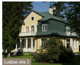
Ludzas iela 3