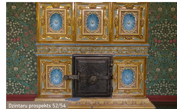
Dzintaru prospekts 52/54