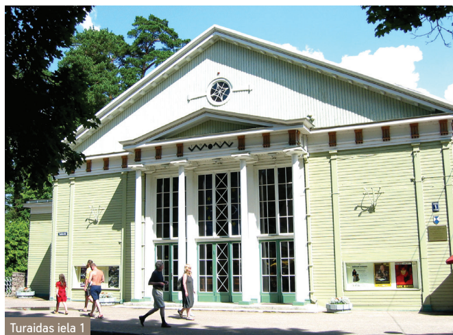
Turaidas iela 1