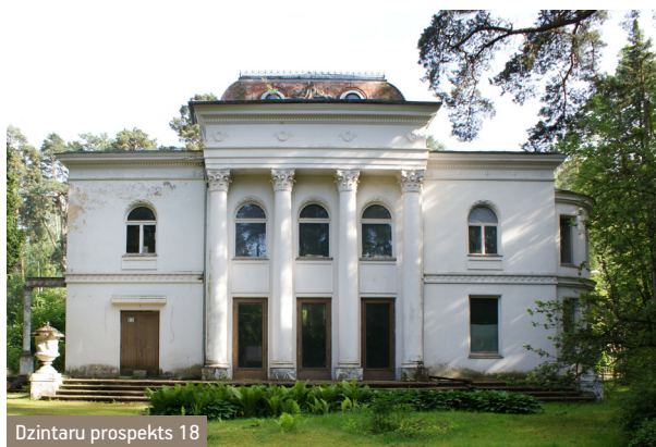
Dzintaru prospekts 18

Jūrmalas kūrorta daba un kultūrvide Dzintaru rajonā 2001. gadā tika iekļauta UNESCO Pasaules dabas un kultūras mantojuma saraksta projektā. Latvijā tikai Rīgas vēsturiskais centrs kopš 1998. gada iekļauts šajā prestižajā sarakstā. Eiropas Padomē izplatītais materiāls par Dzintaru vasarnīcu rajonu ir devis paliekošu iespaidu par Jūrmalu kā savdabīgu koka arhitektūras un dabas vērtību pilsētu. 21.g.s ienesis lielas izmaiņas pilsētubūvniecības teritorijas apbūvē: nojaukts padomju laikā būvētais izstāžu centrs „Daile” un izstāžu zāles Turaidas ielā, un brīvajos zemesgabalos Dzintaru prospektā uzbūvētas vairākas mazstāvu daudzdzīvokļu ēkas . Labiekārtots Dzintaru Mežaparks , iekārtojot vairākus bērnu spēļu laukumus un skatu torni.