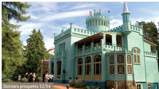
Dzintaru prospekts 52/54