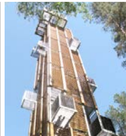
Nousu yli 30 metriä korkeaan näköalatorniin käy kuntoilusta, mutta huipulta avautuva näkymä on vaivan arvoinen.