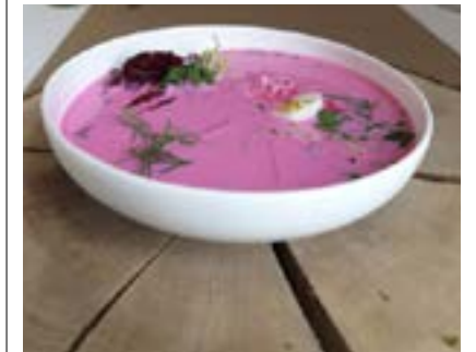
Kylmä keitto on latvialainen erikoisuus, joka sisältää muun muassa punajuurta ja kefiiriä.