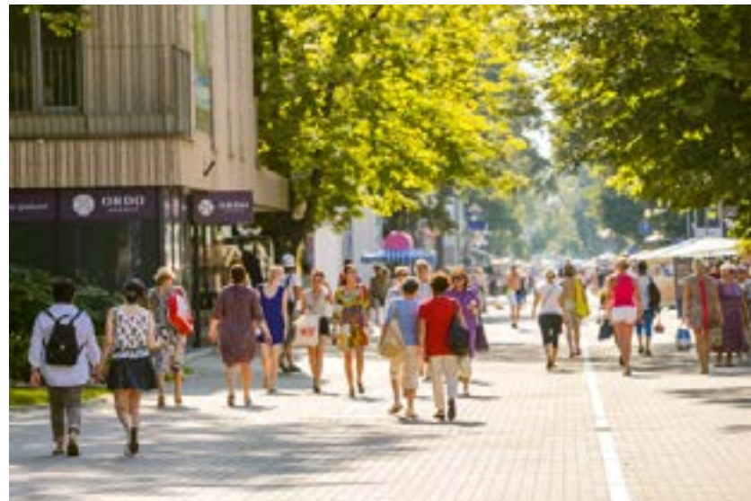
Kesällä Jurmalan kadut täyttyvät matkailijoista.

Rannalla ei huhtikuisena iltapäivänä ollut kuin muutamia ihmisiä lenkkeile-