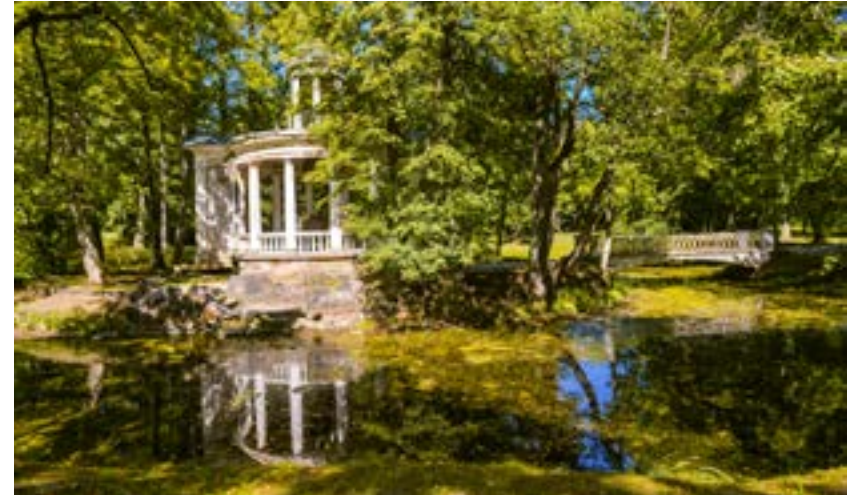
Jurmalassa on romanttisia puistoja, joiden maisemat ovat kuin postikortista.

KUVAT TÄLLÄ AUKKEAMALLA: (TAITEILIJA VITALY JA KYLMÄ KEITTO) TIINA VIRTANEN