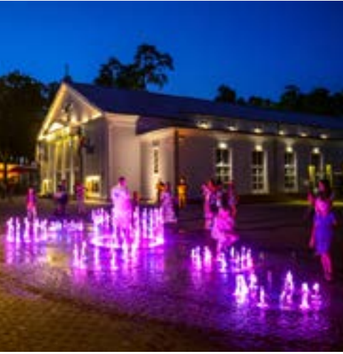
Dzintarin konserttitalo on suosittu tapahtumapaikka.