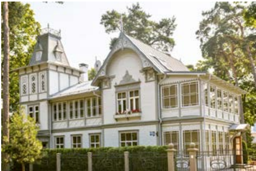
Jurmala on tunnettu kauniista vanhoista pitsihviloistaan, jotka kertovat lomaviettoipaikan menneestä loistosta.

en päässyt, kun hieraisin silmiäni ja ihmettelin, olenko sittenkin Vantaan lähiössä. Kadun varrella oli rakennus, jossa lukee isoin kirjaimin Korso.