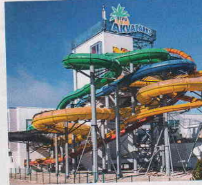
Vesipuisto Livu Akvaparks on lasten suosio