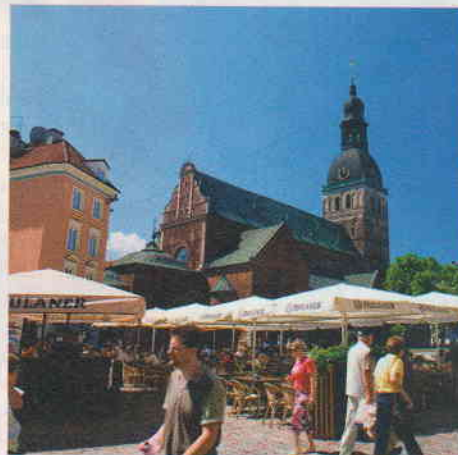
Jurmala-lomalla kannattaa poiketa päiväksi pääkaupunki Riian kävelykeskustaan.

Mutta mitä vauras kivitalojen Hansakaupunki onkaan ainutlaatuisen, yli 400 puuarkkitehtuurin mestariteoksen Jurmalan rinnalla. ●