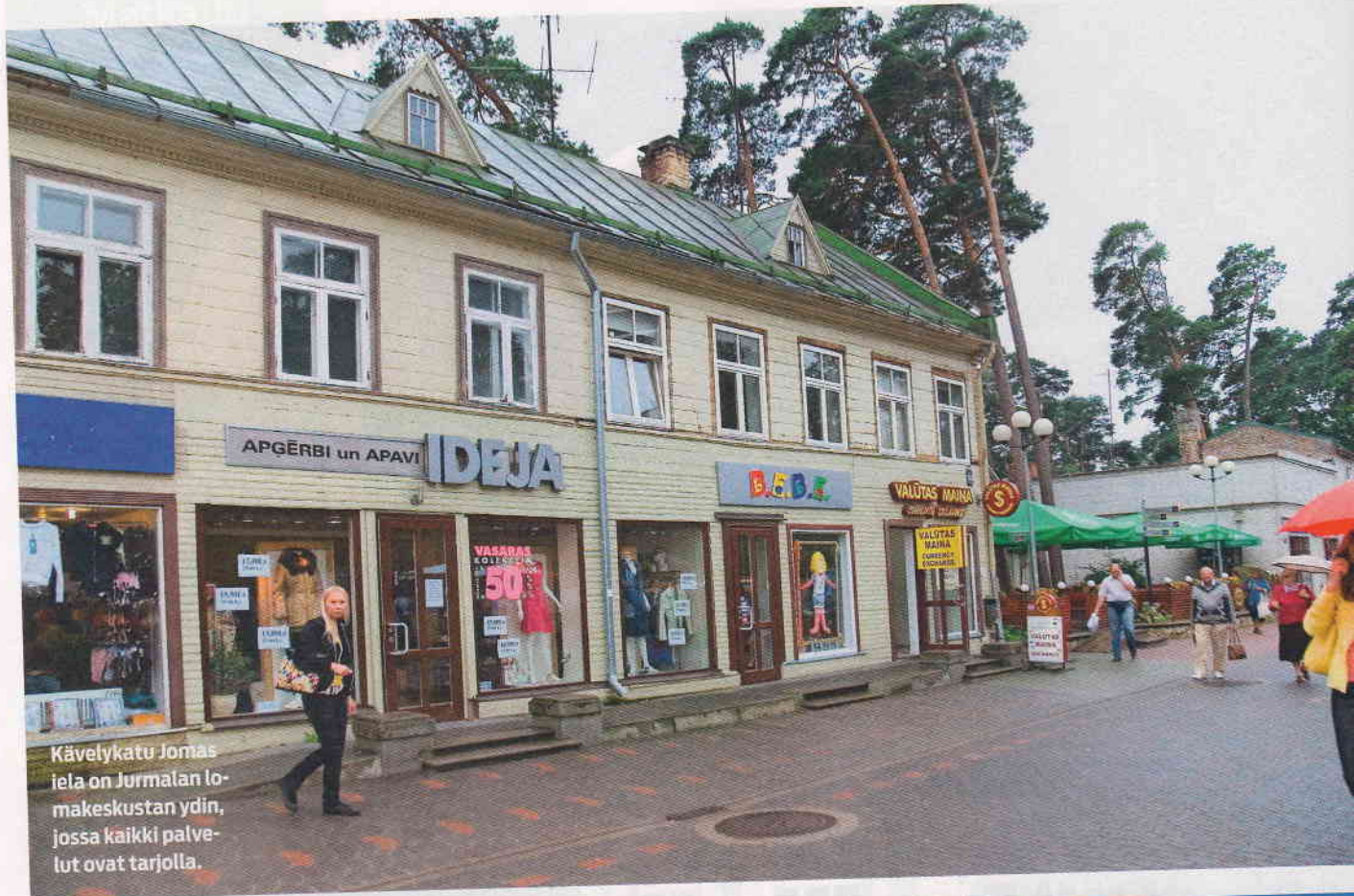
Kävelykatu Jomas iela on Jūrmalan lo-makeskustan ydin, jossa kaikki palvelut ovat tarjolla.