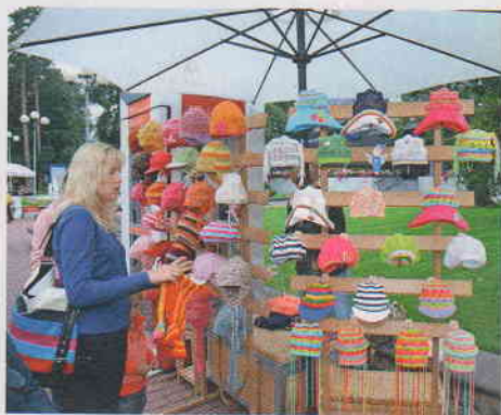
Unohtuiko aurinkohattusi Suomeen? Ei hätää!

Jurmlassa ei törmää toiseen suomalaiseseen joka nurkalla. Kemerin luonnonpuistossa saattaa hetken olla jopa ihan yksin omassa rauhassaan.