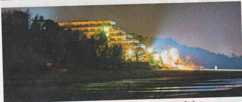
Rannalla sijaitseva Baltic Beach -hotelli hurmaa Jūrmalan romanttisessa yössä.