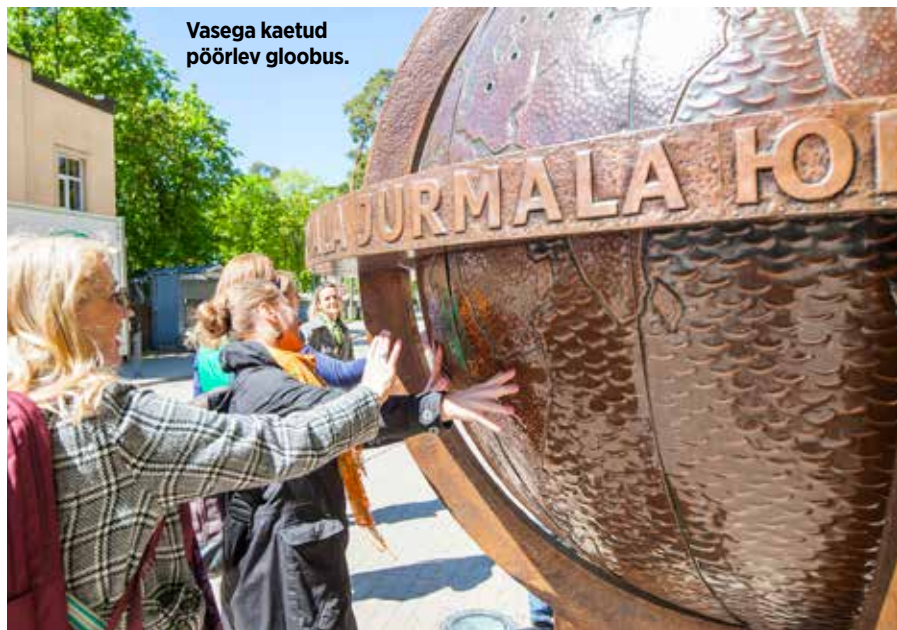
Vasega kaetud pöörlev gloobus.