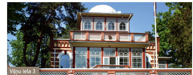
Viļņu iela 3

Railway station in Bulduri has been known since 1877, the hotel from the end of the 19 th century, marketplace from the 1908, and Bulduri Gardening School from 1910. These objects promoted active social life. Apart from the historical establishments in Bulduri, in 21 st century there is also Jūrmala City Hospital, theatre, School of Arts for the children, House of Artists, Jūrmala City Council's House of Land, Diaconal Institute, Medical School, water park "Līvu Akvaparks", several shops and cafes.