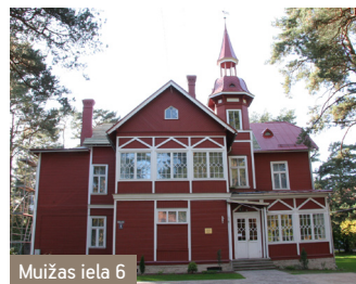
Muižas iela 6