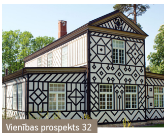
Vienības prospekts 32