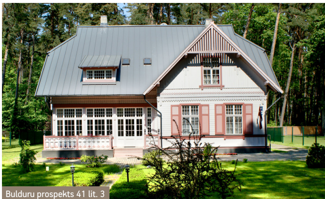
Bulduru prospekts 41 lit. 3

In the Middle Ages, the owner of Bulduri region was Livonian Order. The name "Bulduri" comes from the land tenant Johans Buldrinks (Bulderinga) to whom Livonian Order's master Valters fon Pletenberg assigned a plot of land on the bank of river Lielupe in 1495. Nowadays it is a territory of Bulduri Gardening School . A little later, the territory expanded with the pub and a place for floats up to the end of Vienības avenue (Vienības prospekts). In 1655, Bulduri manor was sold to the duke of Kurzeme – Jēkabs. In 1783, when new borders between Vidzeme and Kurzeme were marked, Bulduri was included in the territory of Vidzeme's vicegerancy. Around 1814, a manor with a barn and brewery were built; float pub was built in 1826. By the river in the area of streets Krūzes, Niedru and Tvaikoņu, first houses of peasants (fishermen) - Putni, Sviesti, Dūči etc. – were located. Citizens who lived near the river mostly were fishermen , and were called "plostgālieši". In 1833 , for the first time, the manor rented out rooms for the vacationers . Dwelling – houses were expanded and adapted for the needs of summer residents. Owners themselves spent summers in the outhouses, bathhouses etc. Together with the development of steamship traffic on the river Lielupe, the pier in the end of Tvaikoņu street (Tvaikoņu iela) was built.