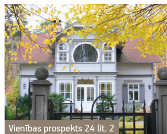
Vienības prospekts 24 lit. 2