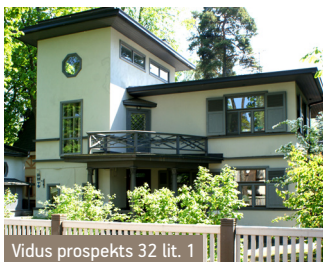
Vidus prospekts 32 lit. 1