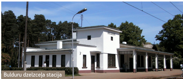
Bulduru dzelzceļa stacija