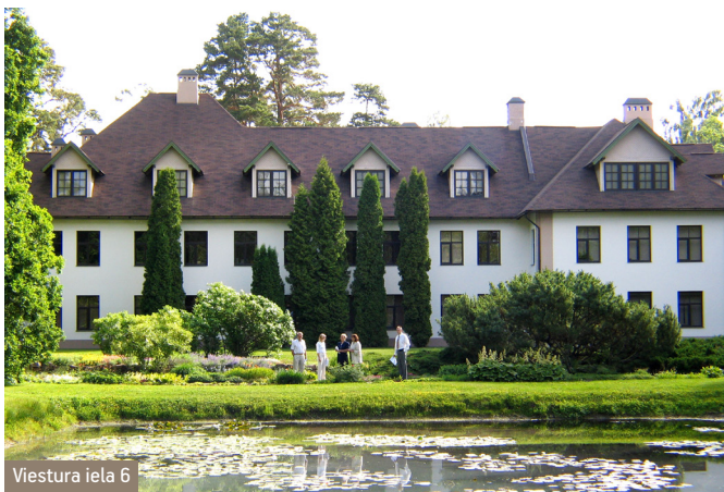
Viestura iela 6

Dzelzceļa piestātne Bulduros ir zināma no 1877.gada, viesnīca no 19.šs beigām, tirgus no 1908.gada, Bulduru dārzkopības skola no 1910.gada. Šie objekti veicināja aktīvu sabiedriskās dzīves veidošanos, kas turpinās arī 21.šs. Bez vēsturiskajām iestādēm Bulduros atrodas Jūrmalas pilsētas slimnīca, teātris, bērnu mākslas skola, mākslinieku nams, bibliotēka, JPD Zemes māja, Diaconijas institūts, medicīnas skola, Līvu Akvaparks, dažādi veikali un kafējnīcas.