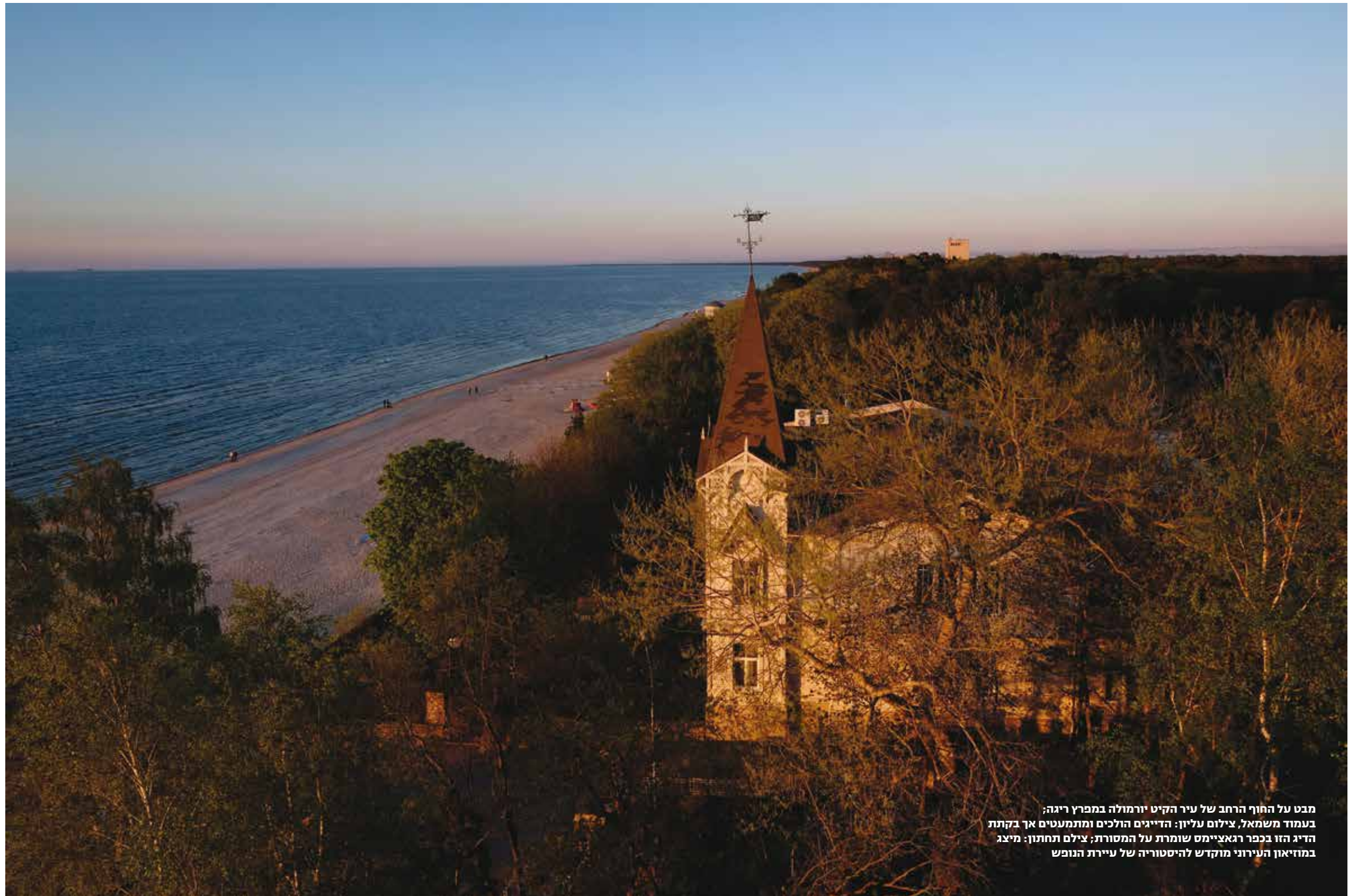
מבט על החוף הרחב של עיר הקיט יורמולה במפרץ ריגה; בעמוד משמאל, צילום עליון: הדייגים הולכים ומתמעטים אך בקתות הדיג הזו בכפר רגאציימס שומרת על המסורת; צילום תחתון: מיצג במוזיאון העירוני מוקדש להיסטוריה של עיירת הנופש

משוטטים ברחובות המוצלים בין וילות העץ, שומעים קונצרט באולם דוֹי־נטרי (Dzintari) ששופץ לאחרונה (התזמורת הפילהרמונית הישראלית בניצוח זובין מהטה תופיע בו באוגוסט) או נוהרים אל מופע רוק באמפי־תיאטרון המכיל אלפי מקומות, מתענגים על טיפולי ספא ומרפא או סתם שוכבים על רצועת החול הרחבה.