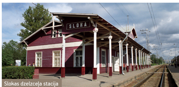
Slokas dzelzceļa stacija

Slokas apkārtnē dažādos laikos risinājies kara darbība, tās liecinieki ir kritušo karavīru kapsētas un piemiņas vietas. Parkā pie pamatskolas 1989.gadā novietots pieminēklis nepatiesi represētajiem jūrmalniekiem. 20. gs 60. gados teritorijā starp vēsturisko Slokas pilsētu un Kaugurciemu tika uzsākta daudzstāvu dzīvokļu namu rajona celtniecība, 21.gs Kauguros dzīvo vairāk kā trešdaļa Jūrmalas pilsētas iedzīvotāju .