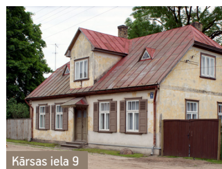
Kārsas iela 9