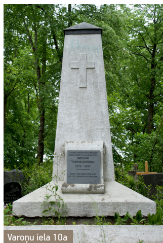
Varoņu iela 10a