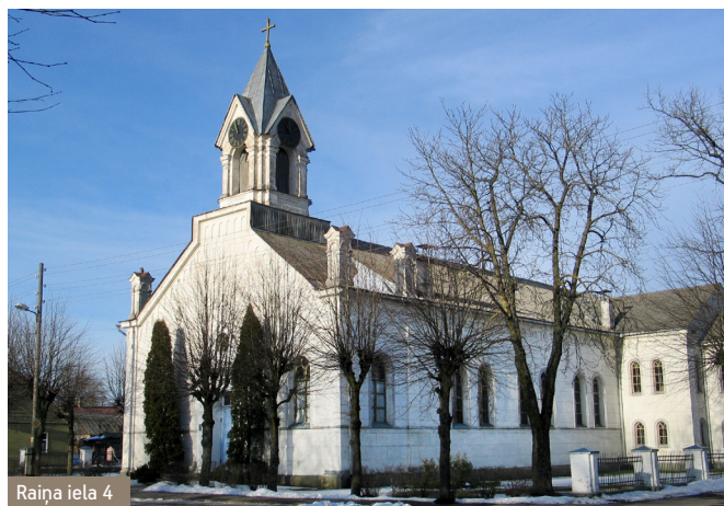
Raiņa iela 4

For the first time the name of Sloka was mentioned in 1255 in the agreement between Livonian Order and the town of Rīga. Sloka began to prosper on the bank of river Lielupe in the 17 th century during the time of Duke Jēkabs's governance, when after deepening the river Slocene, the goods from Sloka started to be delivered by ships into the sea through the port of Kauguri. The limekilns, glass kilns and copper kilns started to work and people started to use windmills .